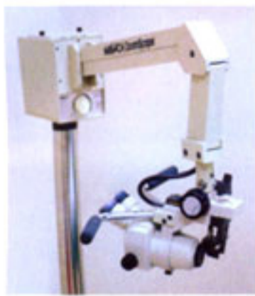
Kolposkopija je bitna

Faktori rizika su od nesumnjivog značaja za pojavu određene bolesti. Prisustvo određenog faktora rizika ne znači ujedno i oboljevanje od neke bolesti. Obično je potrebna kombinacija više faktora koja će usloviti oboljevanje.