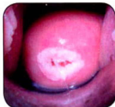
promena na grliću

Zemun, Dubrovačka 3 (centar, kod McDonalds-a) Radno vreme: ponedeljak-petak od 10 do 18h telefon za zakazivanje 011/ 3163 074