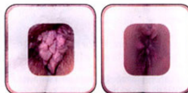
Kondilomi pre i posle radiotalasne intervencije