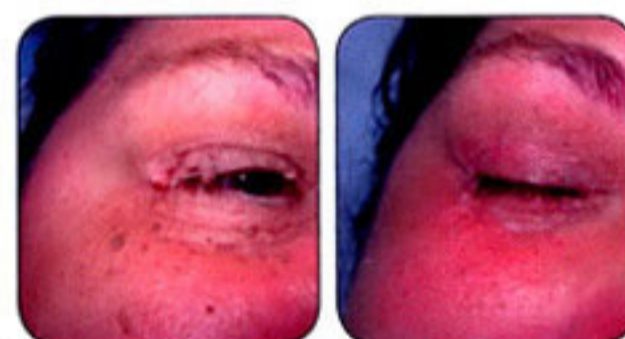
Viseće bradavice pre i posle radiotalasnog uklanjanja