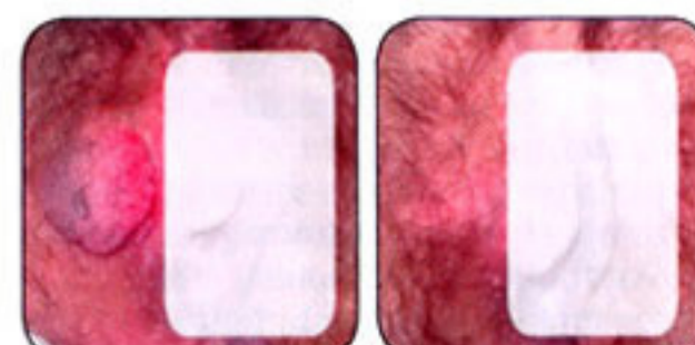
Kondilomi pre i posle radiotalasne intervencije