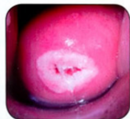
Promena na grliću koja zahteva radiotalasnu LOOP exciziju