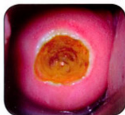
3 minuta nakon radiotalasne LOOP excizije. Promena uklonjena i u dubinu i u širinu